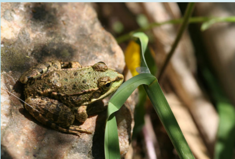
Grenouille verte (O. Duval)