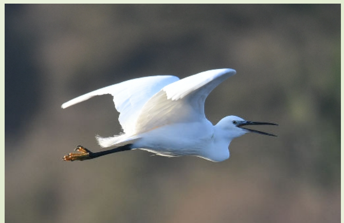
Aigrette garzette

Vous trouverez d'autres informations sur le site internet de MNE http://www.mayennatureenvironnement.fr/le-reseau.html .