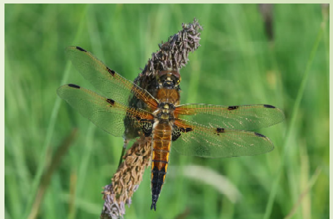
Libellule à quatre tâches (O. Duval)

Grâce à la mairie, de nombreuses sorties pédagogiques permettent aux écoles et collèges de découvrir un environnement préservé. Plusieurs panneaux ont été installés et réalisés par le Syndicat de Bassin de l'Oudon et par MNE, ainsi que 4 hôtels à insectes par le collège Saint-Joseph.